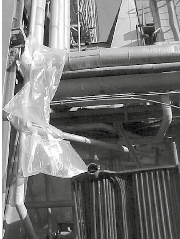
Figura 4. Trabajos sobre calorifugados con sacos con guantes “glove-bag”

Este método puede resultar poco seguro ya que las bolsas de material plástico, se pueden romper dando lugar a la emisión de fibras. Al final de los trabajos es necesario retirar las herramientas y la bolsa con mucho cuidado para evitar la emisión de fibras, sobretodo si no se ha tomado la precaución de impregnar bien los MCA. Por todos estos motivos es importante que el trabajador esté muy bien informado y formado, y utilizar esta técnica sólo en casos puntuales.