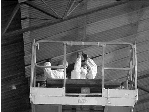
Figura 1. Retirada de placas de fibrocemento