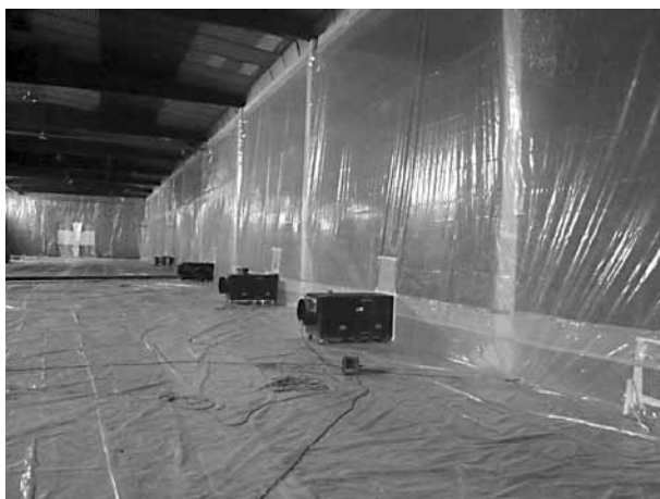
Figura 2. Aislamiento de la zona de trabajo en la retirada de material friable