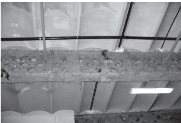
Figura 4. Amianto proyectado en estructura metálica (crocidolita)

En la figura 4 se presenta un ejemplo de una estructura metálica ignifugada, de la que se va a proceder al desamiantado. La empresa que realiza los trabajos de desamiantado es la que tiene que presentar el plan de trabajo correspondiente.