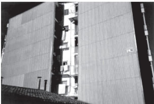
Figura 2. Pared pluvial de fibrocemento con amianto

En todo caso se eliminará el amianto de los materiales que lo contengan antes de empezar cualquier operación de demolición, excepto cuando hacerlo implique mayor riesgo para los trabajadores.