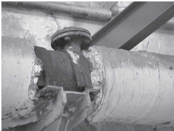
Figura 3. Calorifugado con amianto

En la figura 3 se observa un posible trabajo de reparación o retirada de material friable (que se deshace con facilidad) que presenta unas características específicas que deberán constar en el plan de trabajo, como medidas de confinamiento (glove-bag, burbuja con depresión), equipos individuales de protección respiratoria, entre otras.