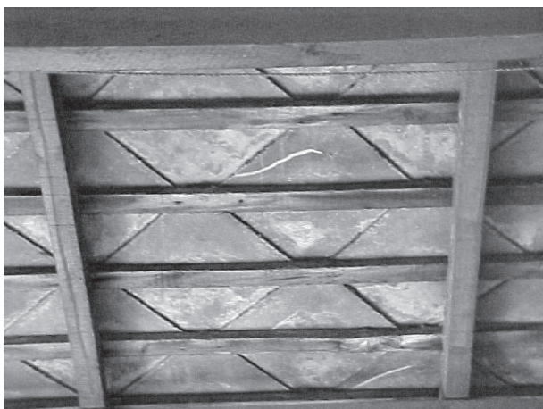
Figura 1. Cubierta con losetas de fibrocemento con amianto

En la figura 1 se observan losetas de fibrocemento que deben ser identificadas como material con amianto.